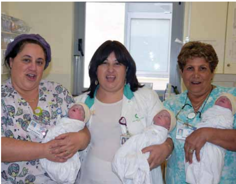
Jong leven temidden van allerhande bedreigingen.